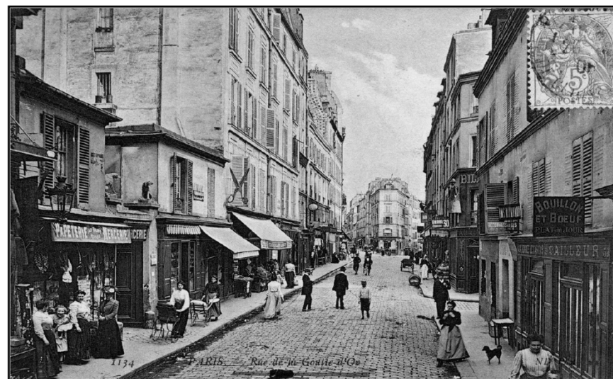
La rue de la Goutte d'Or en 1905

un plan du quartier et le parcours proposé sont en page centrale